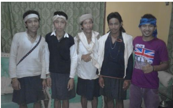
Gambar 5 Masyarakat Baduy berkunjung ke Jakarta

Perubahan itu pasti ada tetapi untuk saat ini khususnya di Baduy Dalam bentuk perubahannya hanya terbatas pada kehidupan sosial masyarakatnya bukan strukturalnya, terutama dalam hal komunikasi yang lebih dipengaruhi oleh banyaknya pengunjung yang datang sehingga untuk saat ini hampir seluruh anak muda Baduy Dalam dapat berkomunikasi dengan bahasa Indonesia. Sedangkan faktor pendukung perubahan masyarakat Baduy adalah dengan dibukanya akses jalan menuju Ciboleger yang dapat dilalui mobil, sehingga akses menuju Baduy semakin mudah dan kemudian diresmikannya Baduy menjadi salah satu objek wisata oleh pemerintah kabupaten Lebak yang membuat Baduy dikenal oleh banyak orang sehingga jumlah pengunjung terus meningkat dan untuk saat ini tidak bisa dipungkiri ketergantungan masyarakat Baduy terhadap wisatawan sangatlah besar.